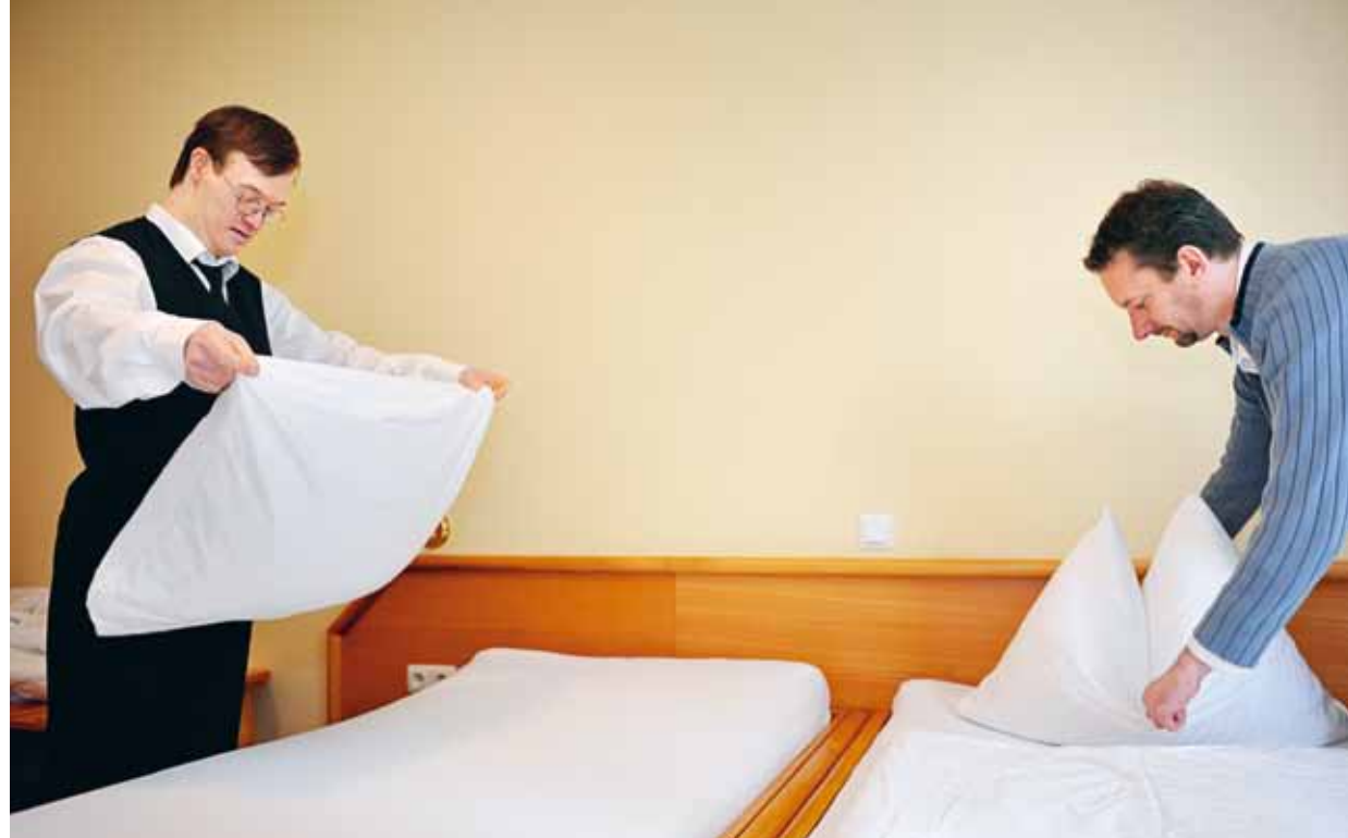
Die Angestellten lieben ihren Job, weil er so abwechslungsreich ist – jeder muss in allen Bereichen arbeiten: Gäste bedienen, Müll entsorgen, Frühstücksservice oder auch Betten machen