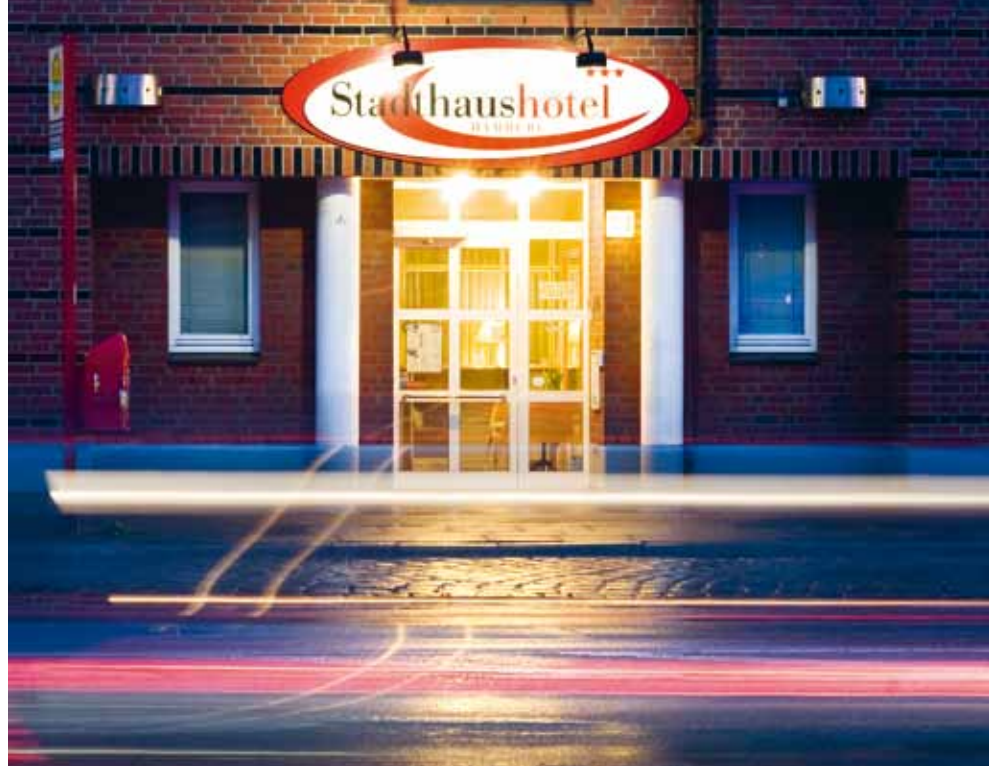
Das Hotel in Altona hat eine Auslastung von gut 80 Prozent. Jetzt soll eine größere Filiale in der Hafen-City entstehen, Hamburgs neuem Prestige-Viertel